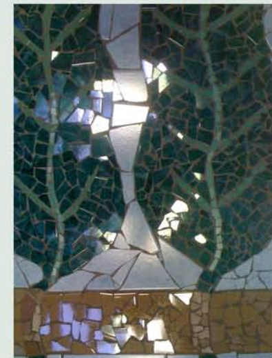
Mosaico "Frammenti" Laboratorio Arteterapia - CD Dongo

La giornata di lavoro dà conto dello stato delle pratiche e delle ricerche in corso nella nostra Regione sui temi sopra menzionati.