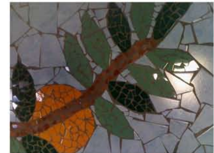
Mosaico "Frammenti" Laboratorio Arteterapia - CD Dongo